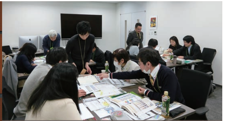
写真は2018.02.22に開催したセミナー & ワークショップの受講風景です