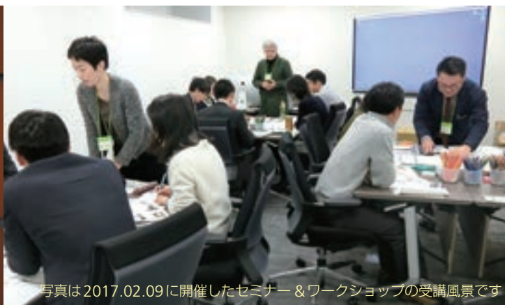
写真は2017.02.09に開催したセミナー & ワークショップの受講風景です